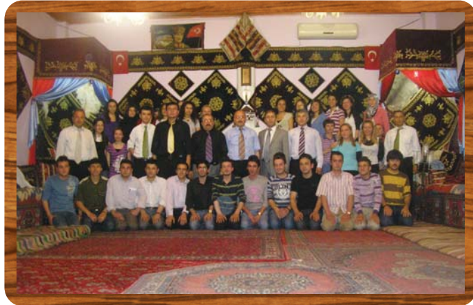
Derneğimiz ve Nurettin Ok Halk Eğitim Merkezi Tarafından Düzenlenen Yöresel Halk Oyunları Yetiştiricilik Kursu Katılımcıları