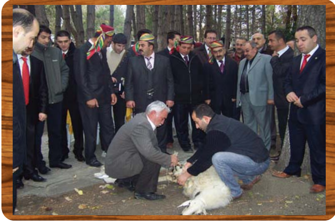
2009 Yılı Yâran Sezon Açılışı Kurban Kesimi