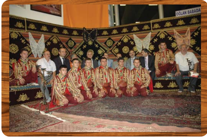
2008 Yılı Ankara Antres'de Çankırı Günleri