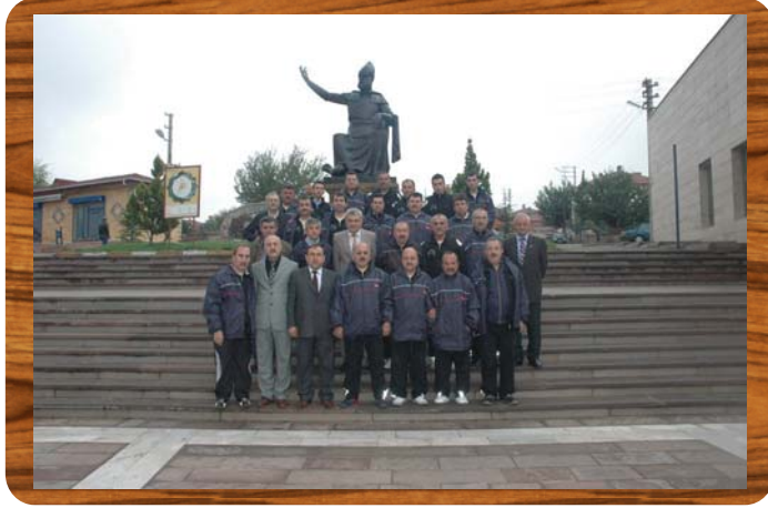
Yâran Meclisimiz Kırşehir Ahi Evran Şenliklerinde