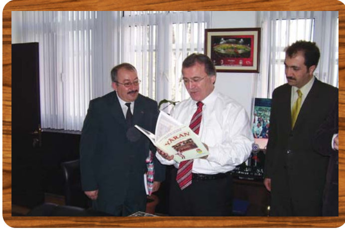
Dernek Yönetimi Kurulumuzun Eski T.B.M.M. Başkanı Sayın Mehmet Ali Şahin'i Ziyareti